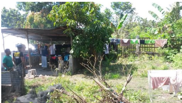
De oude wasplaats.

In Boanio verblijven 27 verstandelijk gehandicapte kinderen in de leeftijd van 0 t/m 16 jaar en er wordt zorg verleent aan 20 kinderen in de kampung. Er zijn 2 zusters en 4 hulpen voor deze 47 kinderen. Kinderen gaan overdag naar de school voor Buitengewoon onderwijs in de stad Mbay en degenen die individuele therapie nodig hebben kunnen dat sinds kort in het nieuwe gebouw krijgen. Het tehuis is afhankelijk van giften vanuit het moederinstituut op Java, de Gemeente en individuele giften. De zusters maken Tempeh (soyabonen-cake) met de kinderen om te verkopen, daarnaast fokken ze eenden, varkens en kippen om inkomsten te vergaren. Het tehuis krijgt sinds 2013 onze aandacht. In dat jaar hebben we de badkamers en keuken gerenoveerd. De was en droogplaats is op de plaats van de oude droogplaats gebouwd, maar dan in een half open gebouw met een verdieping. De begane grond is voor het wassen en de tempeh-productie. De eerste etage voor het drogen van de was. Voor de watervoorziening is er een opslagbak gebouwd.