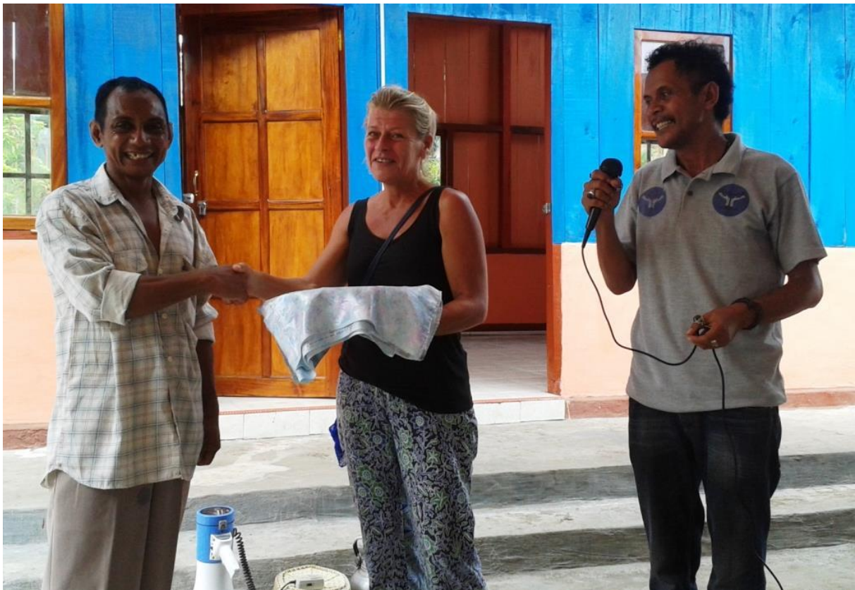
Overdracht van de sleutels in Januari 2016